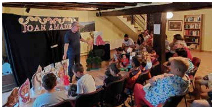
Contes de l'avi Bati Bull Pampoli Circus2.