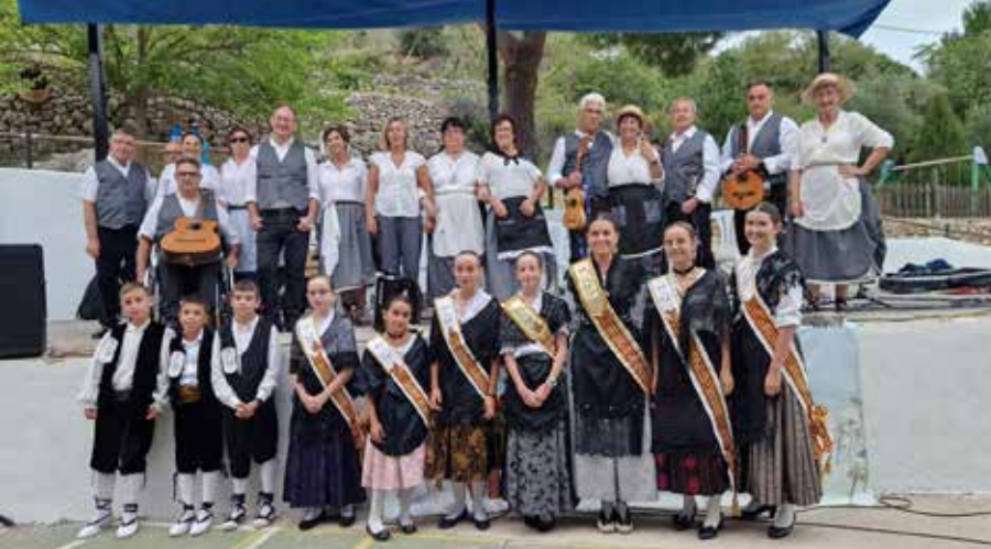
La rondalla Mar i Terra va actuar per festes

PORTAVEU DE L'ASSOCIACIÓ CULTURAL "AMICS DE VALLIBONA"