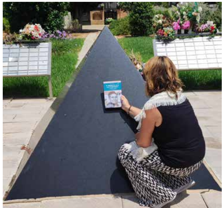
Al cementeri d'Olocau