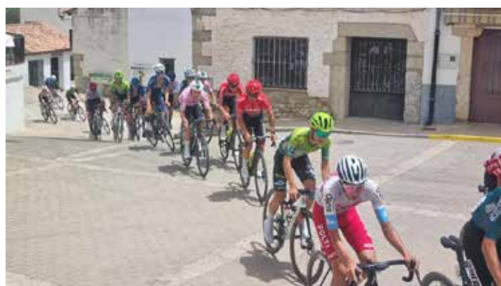
La Volta Ciclista a Castelló va passar pel nostre poble.