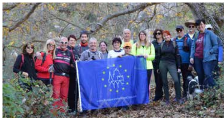
Jornades Europees Patrimoni, celebrades el passat novembre.