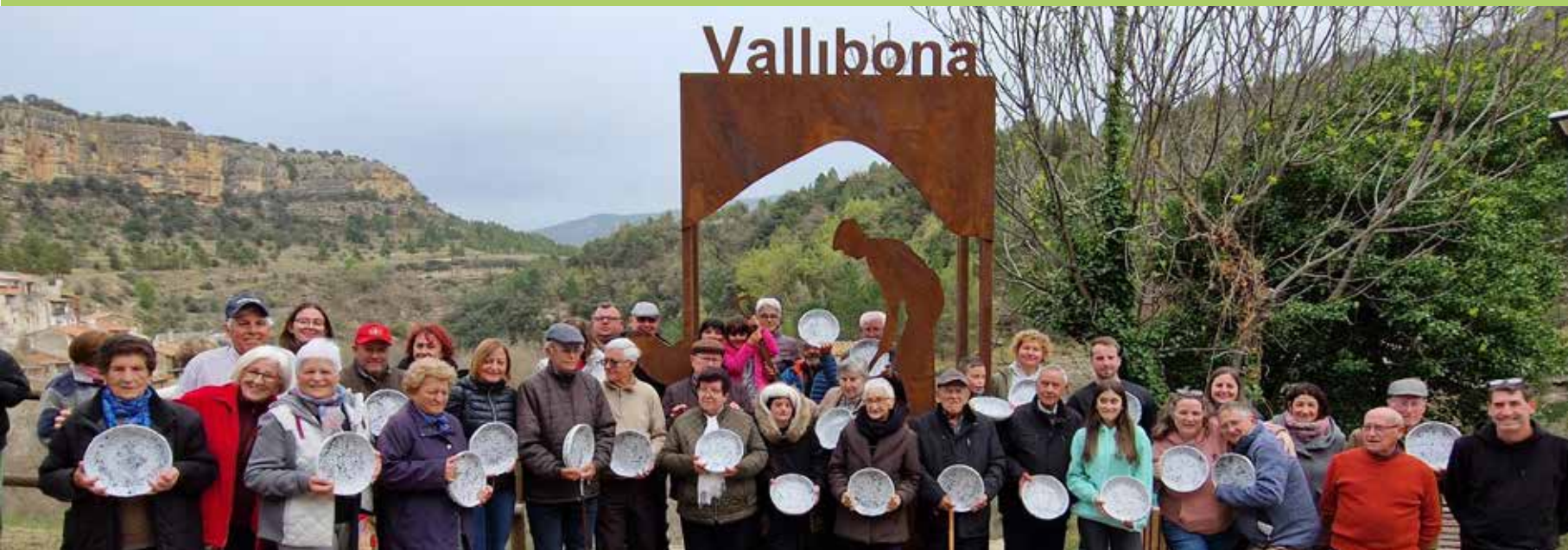
En record dels antics carboners