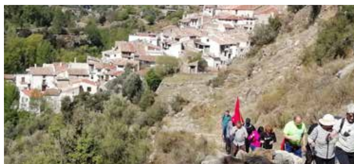
Romeria a Sant Marquet.