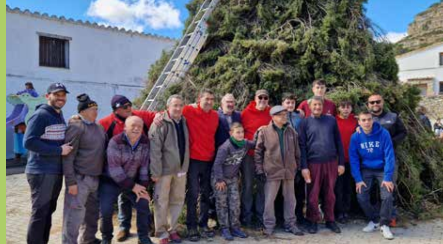
Sant Antoni, de nou, una festa multitudinària